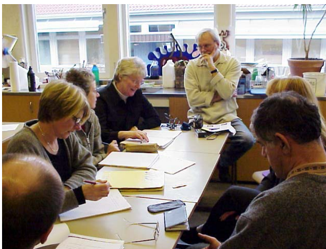
C-spårets arbetslag konfererar i bildsalen